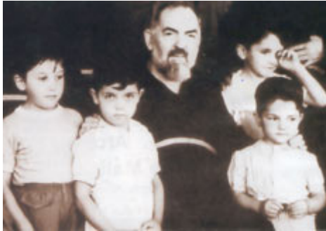
Padre Pio aimait recevoir les enfants, il leur faisait un catéchisme plein d'humour