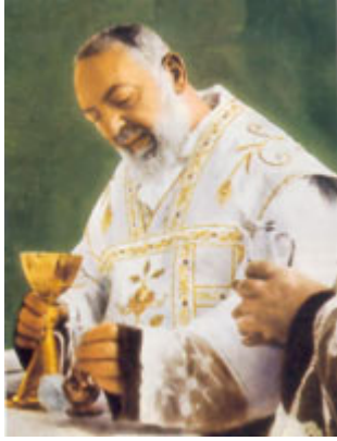
Miracle de la dernière messe

Ainsi priait Padre Pio... Il priait bien, il priait beaucoup, il priait toujours. Il était, au plein sens du terme : l'homme fait prière. Jamais il ne se lassait de prier. Bien plus, on lit dans les lettres qu'il écrivait à ses directeurs spirituels, qu'il se plaignait de ne jamais avoir assez de temps pour prier. Il avait écrit un jour : « Je voudrais que les journées aient quarante heures ! » Il priait partout, à l'autel, au confessionnal, à sa place au matronée de la basilique où on le voyait lever son chapelet comme pour le montrer aux fidèles qui, en bas, le regardaient, priaient avec lui, priaient par lui. Il priait dans les escaliers, dans les couloirs, dans l'ascenseur, dans sa cellule le jour, la nuit, à l'exception des très rares heures de sommeil. Il priait avec des gémissements du cœur, il priait avec des « oraisons jaculatoires », mais il priait spécialement avec son chapelet. Il s'était promis de ne pas réciter moins de cinq rosaires par jour. Il fut vraiment un « dévoreur » de chapelets. Un jour, son supérieur lui demanda combien de chapelets il avait récité dans la journée. Et Padre Pio avait répondu : « Bah ! al mio Superiore, devo dire la verità ! (J'en ai récité trente-quatre !) »